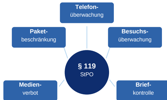
Abbildung: Beschränkungsbereiche nach § 119 StPO (schematisch)